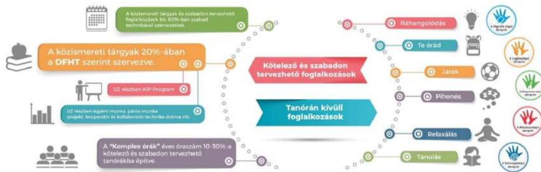
A Komplex Alapprogram tanítási-tanulási stratégiához kapcsolódó elemei

A Komplex Alapprogram által innovált alprogrami foglalkozások és a „Te órád” többnyire a délutáni időszámban valósulnak meg.