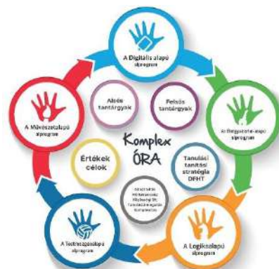
A Komplex órák felépítése